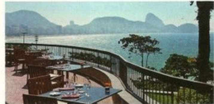
Sofitel Rio de Janeiro.

Forneria São Sebastião Rua Anibal de Mendonça, 112, Ipanema www.forneria.com.br/sao-sebastiao-forneria.php Conçu par l'un des architectes brésiliens les plus en vogue, Isay Weinfeld, ce restaurant est l'endroit idéal pour se retrouver entre amis et savourer antipasti et plats typiquement italiens dans une ambiance détendue et un cadre tendance qui a définitivement su séduire les Cariocas.