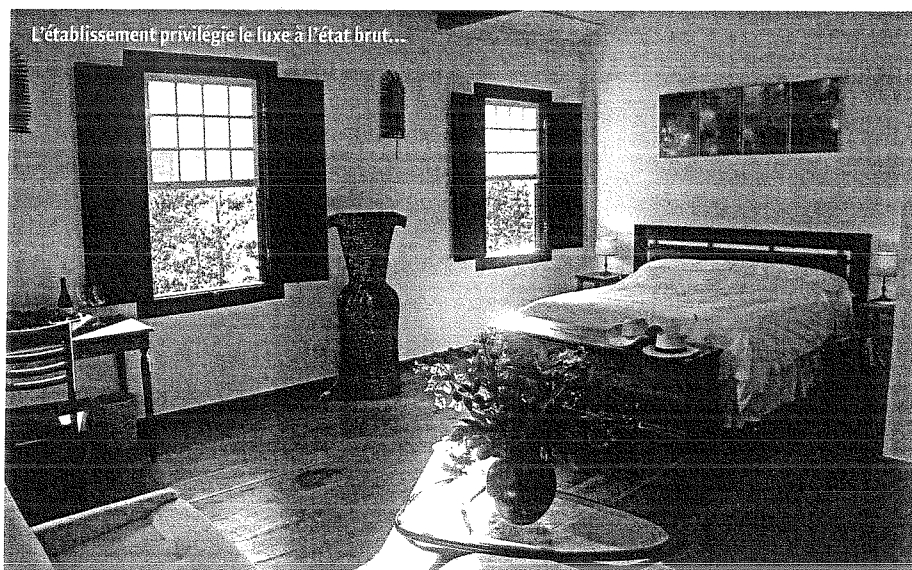
L'établissement privilégie le luxe à l'état brut...

L'approche durable constitue une autre priorité. Les bois et charpentes proviennent de vieilles fazendas de la région, et les eaux usées suivent un traitement 'vert'. Les vingt employés, formés sur place, sont tous issus du village voisin. Le restaurant qui réinterprète les recettes locales utilise les produits bio de la ferme. "Nous poursuivons l'autosuffisance alimentaire. Même le beurre, le café, la cachaça [alcool de canne à sucre, NDLR], et bientôt le vin, sont fabriqués sur place", souligne-t-il. La Fazenda collabore aussi